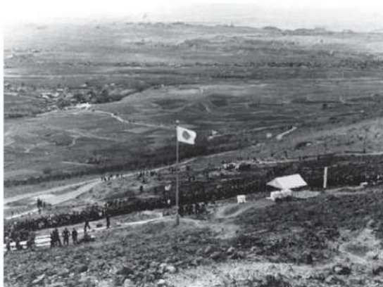
第1回全国植樹祭会場の様子